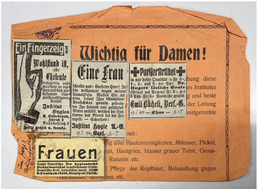
Abb. 2: Informationsbroschüre über Verhütungsmittel und mögliche Adressen, wo diese gekauft werden können.