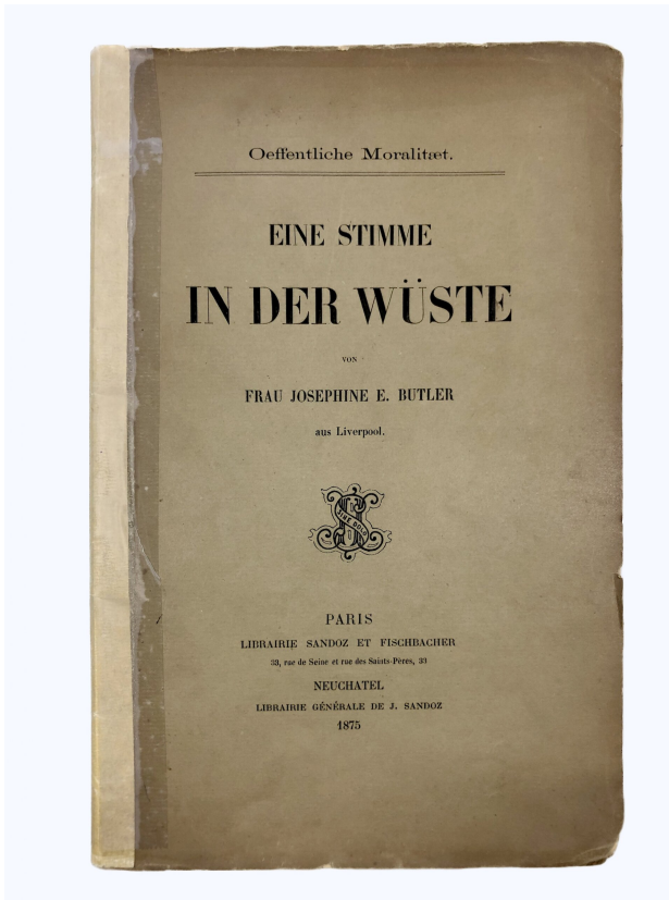
Abb. 2: Eine Stimme in der Wüste (1875), eine der wichtigsten Publikationen Josephine Butlers.

sondern betrachtet das als durchaus berechtigte Sachlage und verhältnißmäßig nur ganz wenige Stimmen erheben sich dagegen – da muß die Frau getrieben von dem edelsten Gefühl der Schwesternliebe thun, was ihr zu thun schwer genug wird, sie muß ihre Natur verleugnen, um einem höheren Befehl zu gehorchen – sie muß hervortreten! [...] Die Reinheit und Heiligkeit ihrer Motive wird die ächte Weiblichkeit ungetrübt erhalten und sie zur Erfüllung jeder gegebenen Pflicht stählen.« 16