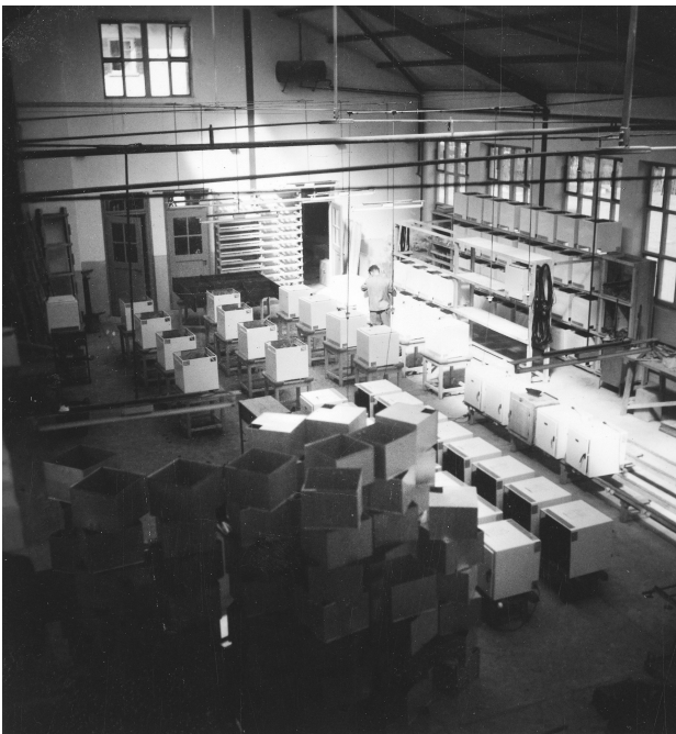
Abb. 9: Die Geschichte der Sibir ist nicht nur für die Geschichte des Trotzismus interessant. So war die Sibir eine der ersten Schweizer Firmen, die auf Massenproduktion und Fließbandarbeit setzten.