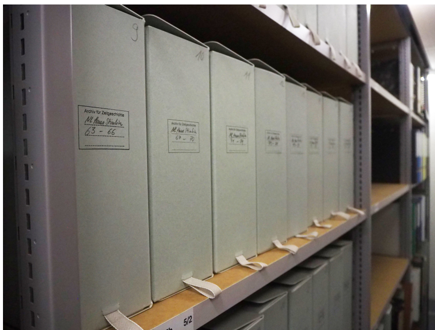
Abb. 3: Stierlins Nachlass im Archiv für Zeitgeschichte umfasst über fünf Laufmeter an Akten. Das sind 33 Schachteln voller Schrift-, Ton- und Bilddokumente.

Die Aussage von Stierlins Sohn stützt diesen Eindruck. Peter Stierlin betont heute, dass die wöchentlichen SAB-Treffen am Dienstagnachmittag für seinen Vater »heilig« gewesen seien. 10 Stierlins Nachlass ist also lückenhaft und zeichnet ein verzerrtes Bild. Nachlässe entstehen grundsätzlich selten nach systematischen Regeln. Sie setzen sich aus Dokumenten zusammen, die von der betreffenden Person aus bestimmten oder unbestimmten Gründen aufbewahrt worden sind und die von den Nachfahr*innen wiederum aus ebenso bestimmten oder unbestimmten Gründen an ein Archiv weitergegeben werden. In noch entscheidenderem Masse als für andere Archivalien gilt es, Nachlässe kritisch zu hinterfragen, deren bisweilen schleierhaften Entstehungsbedingungen in die Analyse miteinzubeziehen, 11 sowie deren »stille Narrative« 12 freizulegen. Die anhand seines Nachlasses vorgenommene Analyse der Sibir als politisches Handlungsfeld des Trotzkisten Stierlin erfordert also drei Schritte: Zunächst braucht es eine Auslegeordnung der einschlägigen Dokumente aus dem Nachlass. In einem zweiten Schritt muss nach den Lücken gefragt werden. Erst diese beiden Schritte erlauben es schliesslich, Stierlins politischen Aktivismus anhand des Nachlasses zu charakterisieren.