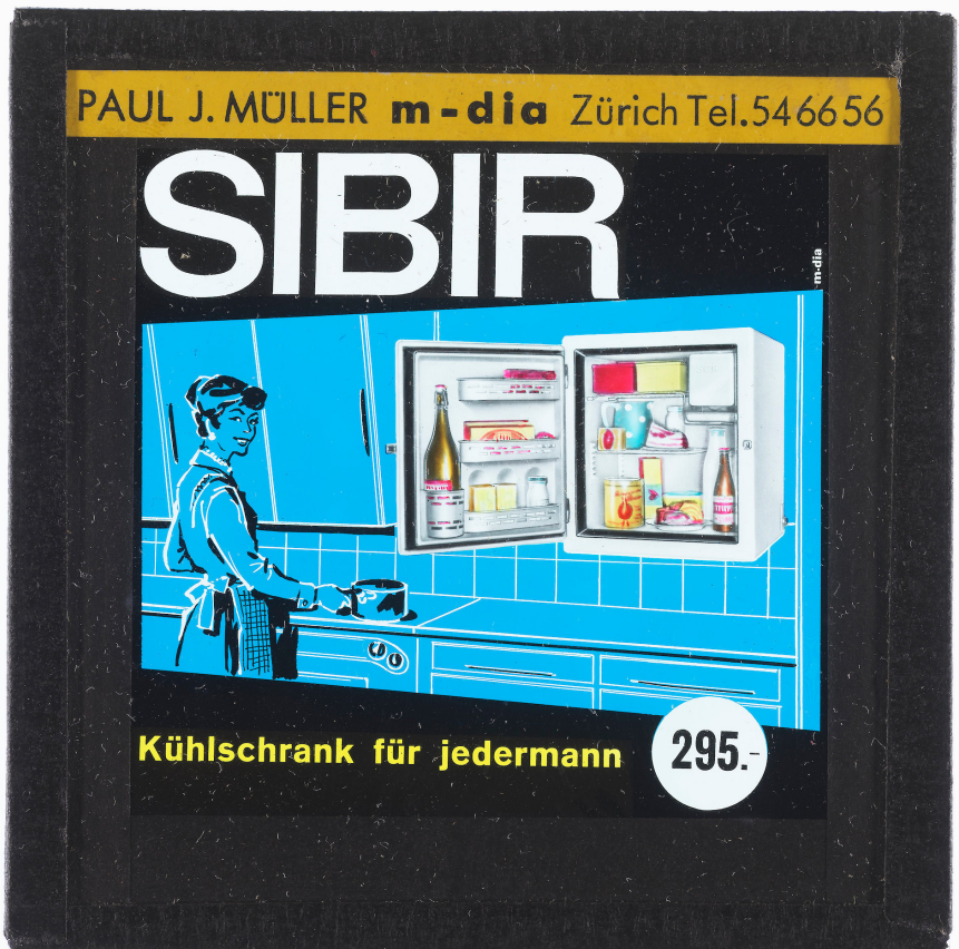
Abb. 2: Sibir positionierte sich als Firma, die jedem Haushalt einen Kühlschrank ermöglichen wollte. Damit trug sie zu einer einschneidenden Veränderung des Konsumverhaltens in der Schweiz bei.