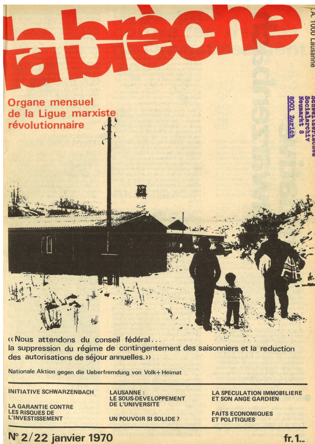
Abb. 4: Der Blick von aussen: Die Lebensbedingungen vieler Saisonniers waren katastrophal. In den migrationspolitischen Debatten blieben sie oftmals stimm- und gesichtslos.

Das wirksamste Mittel des Widerstandes sei daher die Einheit der Arbeiterklasse. Das Narrativ der »Einheitsfront«, das verschiedene Schichten und soziale Lagen von Arbeiter*innen wie Frauen, Migrant*innen, Facharbeiter*innen zusammenfasst, war zentral für den marxistisch orientierten Flügel der Arbeiter*innenbewegung. Umso erstaunlicher ist an dieser Stelle, dass – wie bereits im SAB-Grundsatzdokument aus den 1950er Jahren – ethnisierend von der »Schweizer Arbeiterklasse« als solcher gesprochen wird, jedoch gleichzeitig Immigrant*innen dazu gezählt werden. Auch die LMR scheint sich bezüglich der Initiative also schwer getan zu haben, eine nationale Problematik internationalistisch zu beantworten.