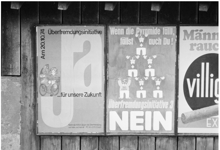
Abb. 1: Der Abstimmungskampf rund um die Schwarzenbach-Initiative markiert einen Wendepunkt in der migrationspolitischen Debatte der Schweiz. Ihm folgten in rascher Kadenz weitere sogenannte »Überfremdungsinitiativen«.

Die Initiative, benannt nach ihrem Ideen- und Taktgeber James Schwarzenbach, markiert somit eine Zäsur in der Schweizer Nachkriegsgeschichte. Zahlreiche Akteure beteiligten und engagierten sich an der Debatte rund um die Initiative: die Regierung, das Parlament, verschiedene Parteien, Wirtschaftsverbände, Medien, Arbeitgeberverbände, Gewerkschaften und vereinzelt migrantische Organisationen.