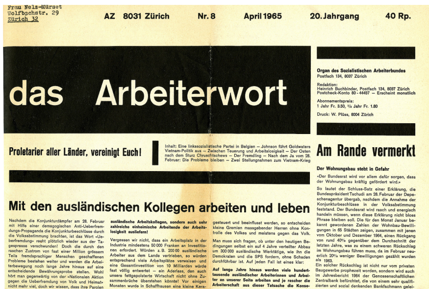
Abb. 3: Migrationspolitische Artikel erschienen im Arbeiterwort bei konkreten politischen Ereignissen wie Initiativen besonders häufig.

Die Kurzgeschichte steht mit dieser utilitaristischen und ökonomischen Argumentation durchaus sinnbildlich für das Argumentationsmuster, welche die Artikel vor der Schwarzenbach-Initiative im Arbeiterwort prägen. Es wird zum Beispiel betont, dass italienische Bauarbeiter der Schweiz nützen würden, da sie vielfach mehr Wohnraum bauen, als sie benötigen.