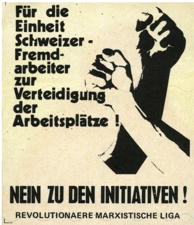
Abb. 2: Die LMR/RML argumentierte klassenkämpferisch: Xenophobie spalte die Klasse der Arbeiter*innen.

In diesem Spannungsfeld wurde die Migrationspolitik auch für die Schweizer Trotzlist*innen zum Thema. Die Linkstendenz innerhalb der POP, aus der daraufhin die LMR entstand, grenzte sich gemäss dem Westschweizer Historiker Pierre Jeanneret unter anderem über die Forderung nach einem Wandel in der Migrationspolitik von ihrer Mutterpartei ab. Jeanneret schreibt: